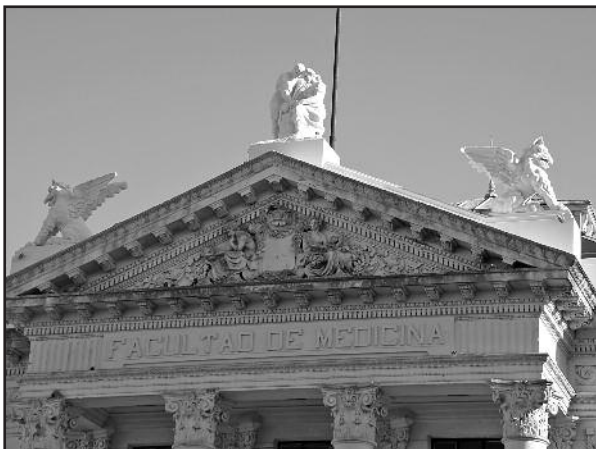
Figura 2. Grifo en la fachada de la Facultad de Ciencias Médicas de Rosario (detalle).